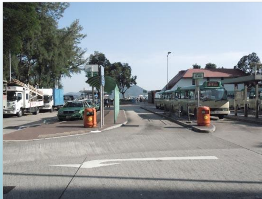
西貢市中心(交通總站)